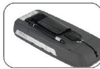
Standart Kapasiteli Li-Ion Polymer Batarya 4.2V 2600 mAh