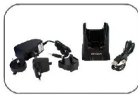
Şarj Adaptörü 5V1.A