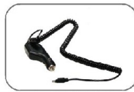
Araç Şarj Adaptörü