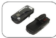
Bel Askılı Deri Koruma Kılıfı