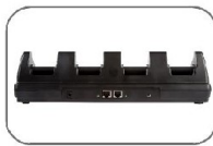
4 Yuvalı Şarj ve Veri Aktarım Kızağı