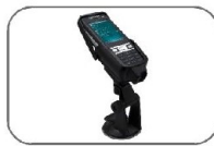
Araç Montaj Kiti