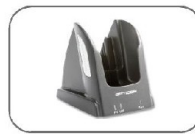
Şarj ve Veri Aktarım Kızağı