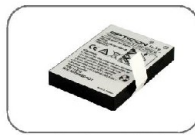
Standart Kapasiteli Li-Ion Polymer Batarya 4.2V 1580 mAh